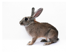
Een konijn is met zijn achterpoten een zoolganger en met zijn voorpoten een teenganger

Bij zoogdieren onderscheiden we zoolgangers, teengangers en teentopgangers. Mensen, apen, beren, olifanten zijn zoolgangers, de hele voet en tenen raken de grond om het gewicht te verdelen, ze zijn niet zo snel. Katachtigen, honden, wolven, vossen zijn teengangers, ze lopen als het ware op hun tenen, waardoor ze onhoorbaar kunnen sluipen om een prooi te vangen en goed kunnen rennen om het prooi te achtervolgen. Teentopgangers of hoefdieren zijn grazende dieren, ze lopen op het topje van hun tenen, de hoef. Daarmee kunnen ze zich goed afzetten, om snel weg te rennen van gevaar. Voorbeelden van hoefdieren zijn paarden, varkens, koeien, reeën, herten, schapen en geiten. Er zijn ook tussenvormen: een konijn is met zijn achterpoten een zoolganger en met zijn voorpoten een teenganger.