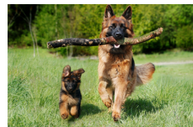
Een hond loopt op zijn tenen