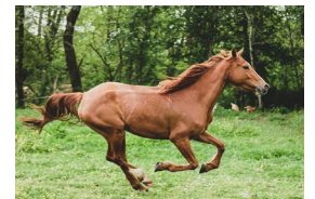
Een paard loopt op het topje van zijn tenen: hoeven